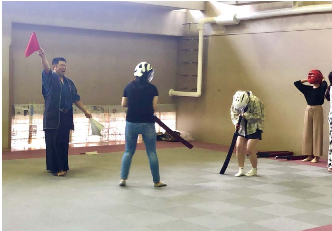
決着・判定の瞬間